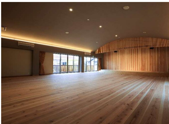
ホールの床・壁・ルーバーに天竜杉を使用