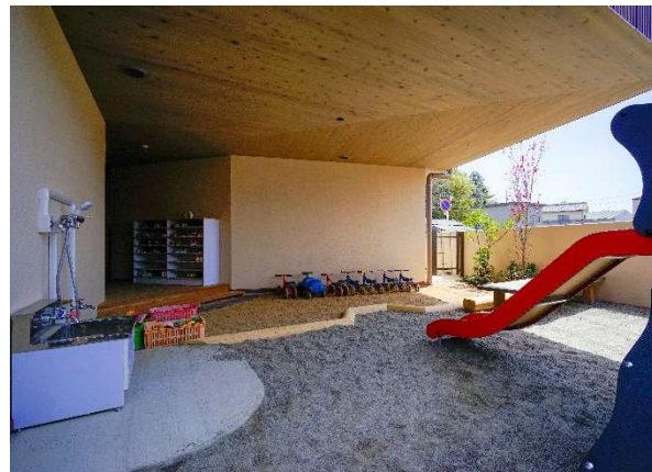
木の温もりを感じる園庭 (天竜杉の軒天)